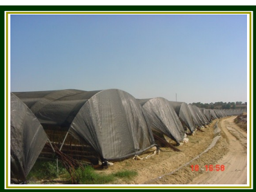
Ce filet est idéal pour donner de l'ombre, brise-vent et pour protéger les façades du bâtiment